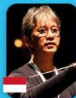
Budi Utomo Prabowo INDONESIA